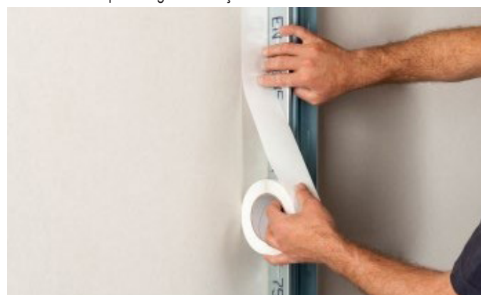
2. Trenn-Fix līmēt blakus profilam

Sekojošo krāsošanas darbu laikā atdalošā šuve salaiduma zonā jāpārņem. Lieko Trenn-Fix pēc neilga laika noņem.