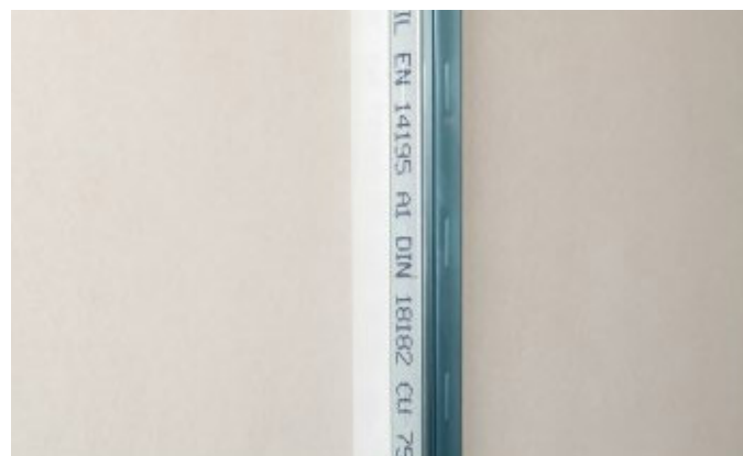
4. Trenn-Fix piespiest un izlīdzināt