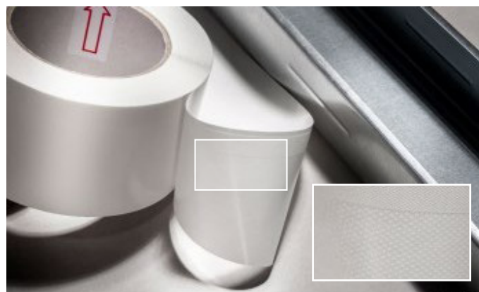
3. Šauro, stipri līpošo līmēšanas zonu savienojiet tieši ar profilu