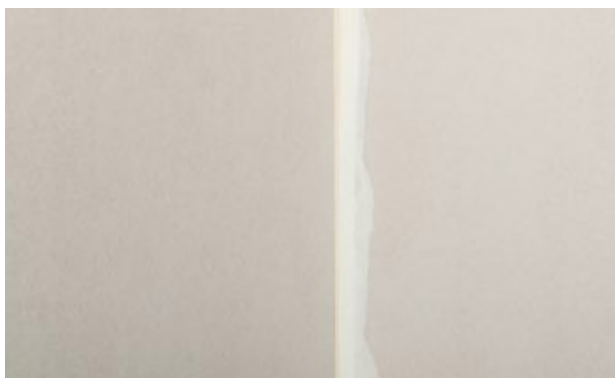
9. Ilgstoši funkcionējošs būvkonstrukcijas salaidums