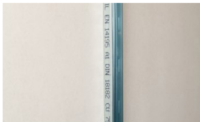
1. Piestiprina profilu uz esošās vai blakus būvkonstrukcijas.

Knauf Trenn-Fix uzlīmē būvkonstrukciju salaiduma zonā uz savienojamās gludās virsmas (piem., apmetuma, betona, koka, sausās būves elementiem utt.) tā, lai šaurā, stipri līpošā līmēšanas zona beidzas tieši līdž ar uzmontēto sausās būves profilu.