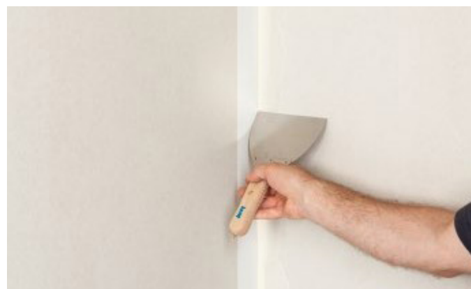
6. Šuvi nošpaktelēt