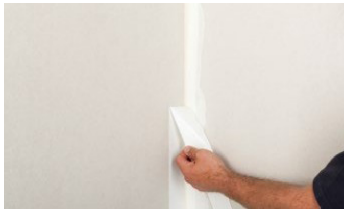
8. Lieko lenti noplēst