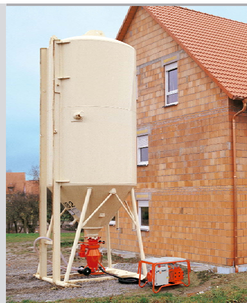
PNEUMATICKÉ DOPRAVNÍKY PFT