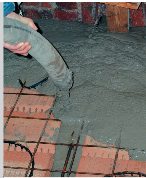
Pompe de mortar PFT