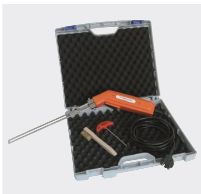
PFT MINICUT 230 mm im Koffer