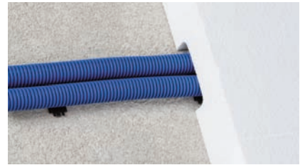
... zur Verlegung eines Leerrohrsystems.