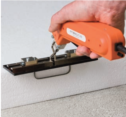
PFT MINICUT 230 mm mit Profilschnitt-Adapter