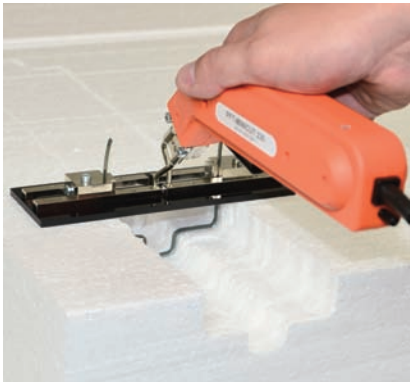
Frei wählbare Formen, z. B. Nut- schnitte entstehen durch einfaches Biegen des Schneide-Bands.