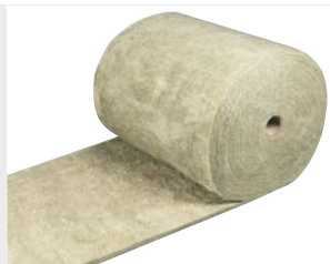
Urbanscape Green Roll Substrat

Die Fasern speichern Wasser und geben es bei Bedarf wieder ab. Außerdem wird bei hohen Temperaturen die Verdunstung des Wassers verlangsamt.