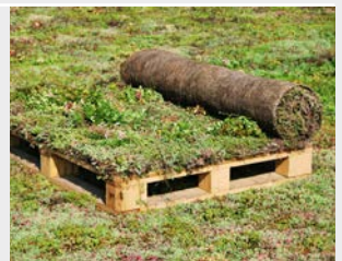
Urbanscape Sedum Mix Vegetationsmatte

Sedumpflanzen sind in der Lage, Wasser in ihren Blättern zu speichern und sind daher bestens geeignet, längere Trockenperioden zu überdauern.