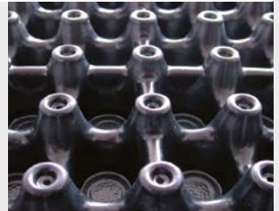
Urbanscape Drainage System mit Wasserspeicher

Das Urbanscape Drainage System mit Wasserspeicher besteht aus einer doppelseitigen Drainage- und Wasserspeicherplatte, die aus Polystyrol hergestellt ist. Sie hat eine exzellente Tragkraft und wurde speziell für Gründächer entwickelt. Die Platten sind auf einer Seite perforiert. Wenn sie mit der perforierten Seite nach oben verlegt werden, ermöglicht dies eine zusätzliche Wasserspeicherung in Trockenzeiten bzw. eine schnelle Abführung von Überschusswasser in Nässeperioden. Außerdem wird der Wurzelbereich der Pflanzen mit Sauerstoff versorgt. Das Urbanscape Drainage System ist aus hochwertigem Qualitätskunststoff hergestellt und daher leichter und belastbarer als vergleichbare Entwässerungssysteme.