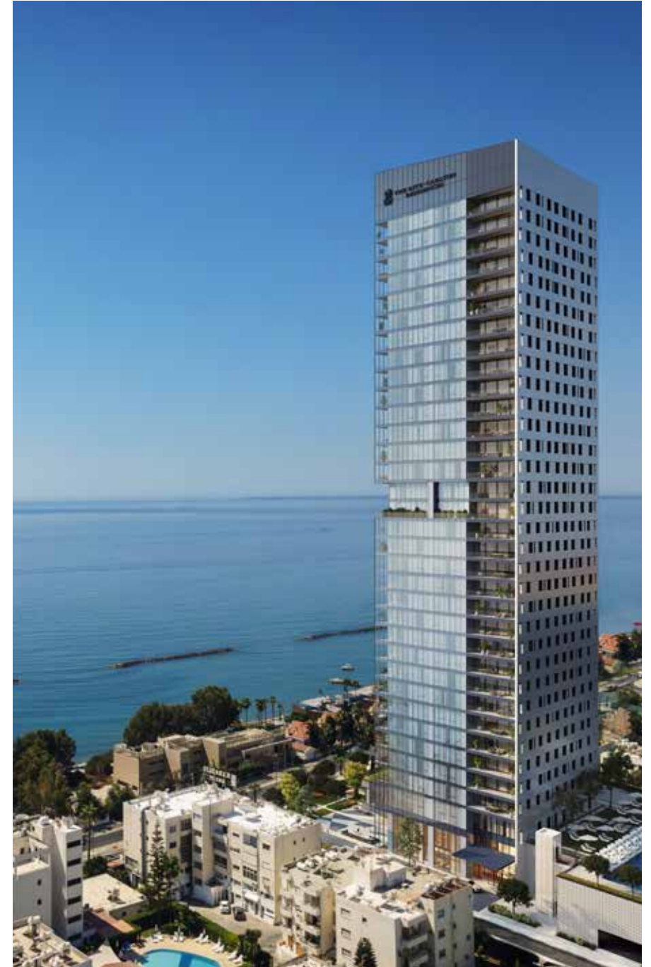
Ritz-Carlton Residences Λεμεσός / Limassol, CY

Project Developer: Marfields Enterprises