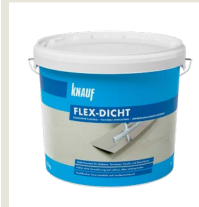
Hochflexibles, hydraulisch abdichtendes, einkomponentiges Abdichtsystem auf Zementbasis unter Fliesen und Platten.