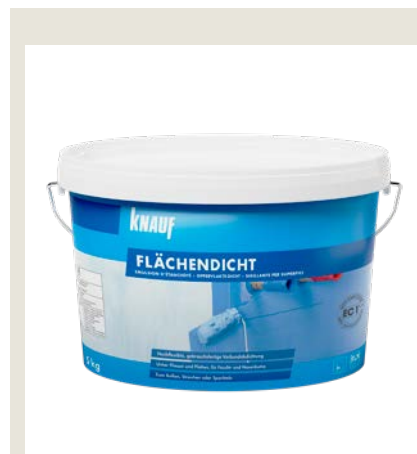
Knauf Flächendicht ist ein gebrauchsfertiges, flüssig zu verarbeitendes Abdichtsystem für Feucht- und Nassräume auf Dispersionsbasis.