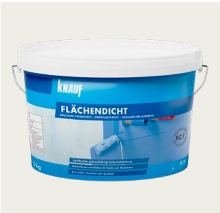
Polymerdispersion – Knauf Flächendicht