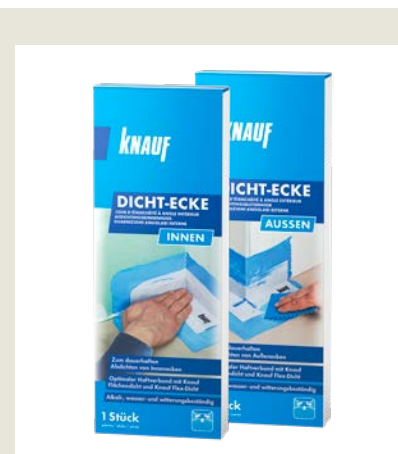
Elastische Dichtecke zum dauerhaften Abdichten und Kompensieren von Dehnungsspannungen in Innen-/Außenecken als Bestandteil der Knauf Abdichtsysteme.