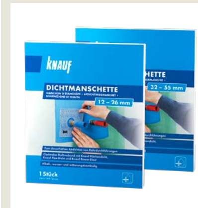
Beidseitig vliesbeschichtete Dichtmanschette mit hochflexibler Dehnzone zum dauerhaften Abdichten von Rohrdurchführungen.