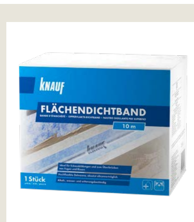
Beidseitig vliesbeschichtetes, elastisches Dichtband mit hochflexibler Dehnzone zum Abdichten und Kompensieren von Dehnungsspannungen in Eckbereichen.