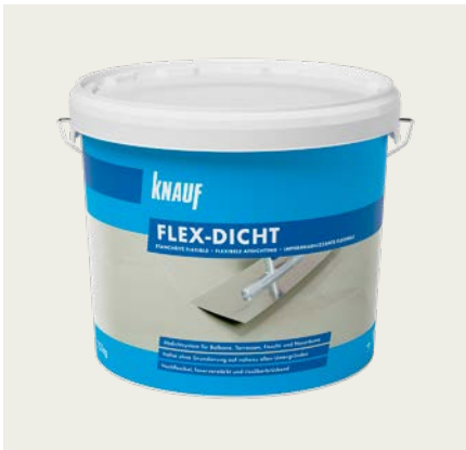
Mineralischen Dichtungsschlämmen – Knauf Flexdicht