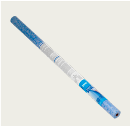
Abdichtung- und Entkopplungsbahn als Alternative von W0-I bis W3-I