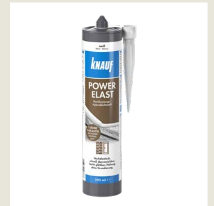
Gebrauchsfertiger, einkomponentiger Hybriddichtstoff: Für das Verkleben bzw. Abdichten der Knauf Abdichtungsbahn im Stoßbereich sowie Knauf Dichtmanschetten und Flächendichtband.