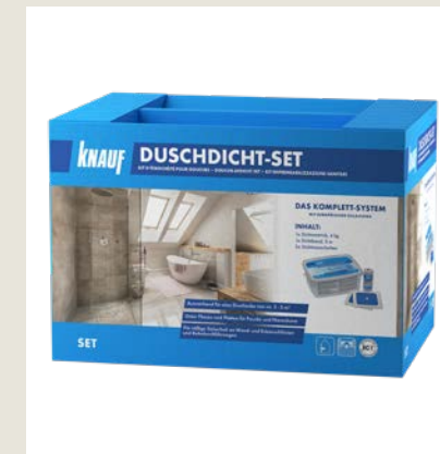
Enthält gebrauchsfertigen dispersiven Knauf Duschdicht Dichtungsanstrich mit zugehörigem Duschdichtband und zwei Dichtmanschetten.