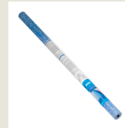
Zum Abdichten und Entkoppeln unter keramischen Fliesen, Natursteinen und anderen im Dünn- und Mittelbett zu verlegenden Belägen.