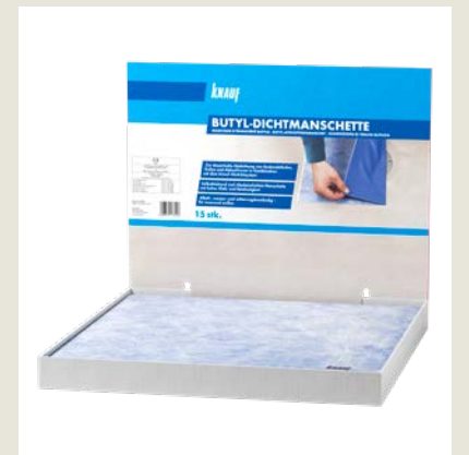
Zum dauerhaften Abdichten von Bodenabläufen wie Gullys und Ablaufrienen als Bestandteil der Knauf Abdichtsysteme.